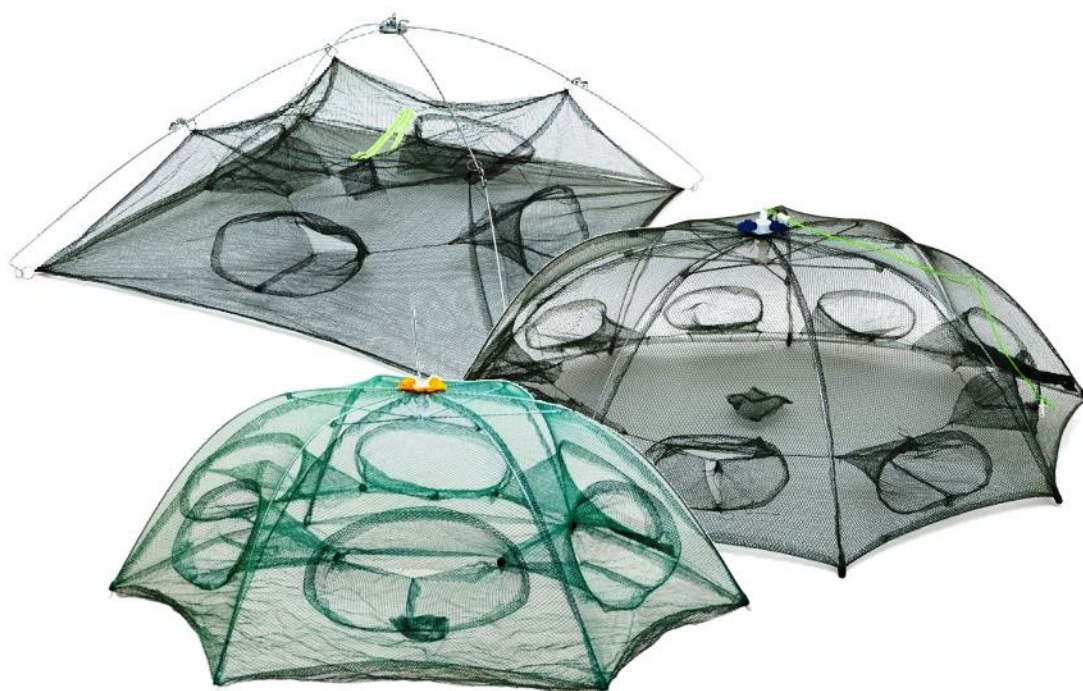
Narzędzia rybackie pułapkowe sprzedawane jako podrywki wędkarskie

Podrywka jak sama nazwa wskazuje jest to sieć rozpięta na ramach lub obręczach, którą zanurza się w wodzie i podrywa po napłynięciu nad nią ryb. Wędkarz podczas wędkowania może używać podrywkę nie większą niż o wielkości 1 m x 1 m i oczkach nie mniejszych niż 5 mm x 5 mm.