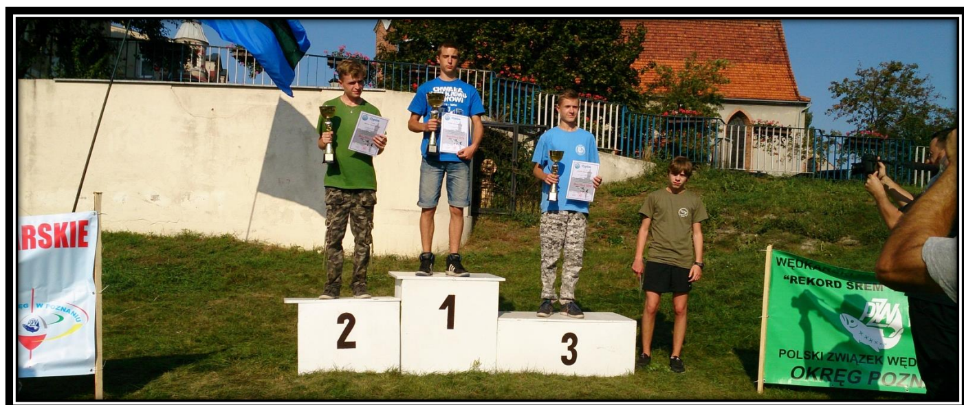
Spinningowe GPx Okręgu Boleń Warty Śrem 2016