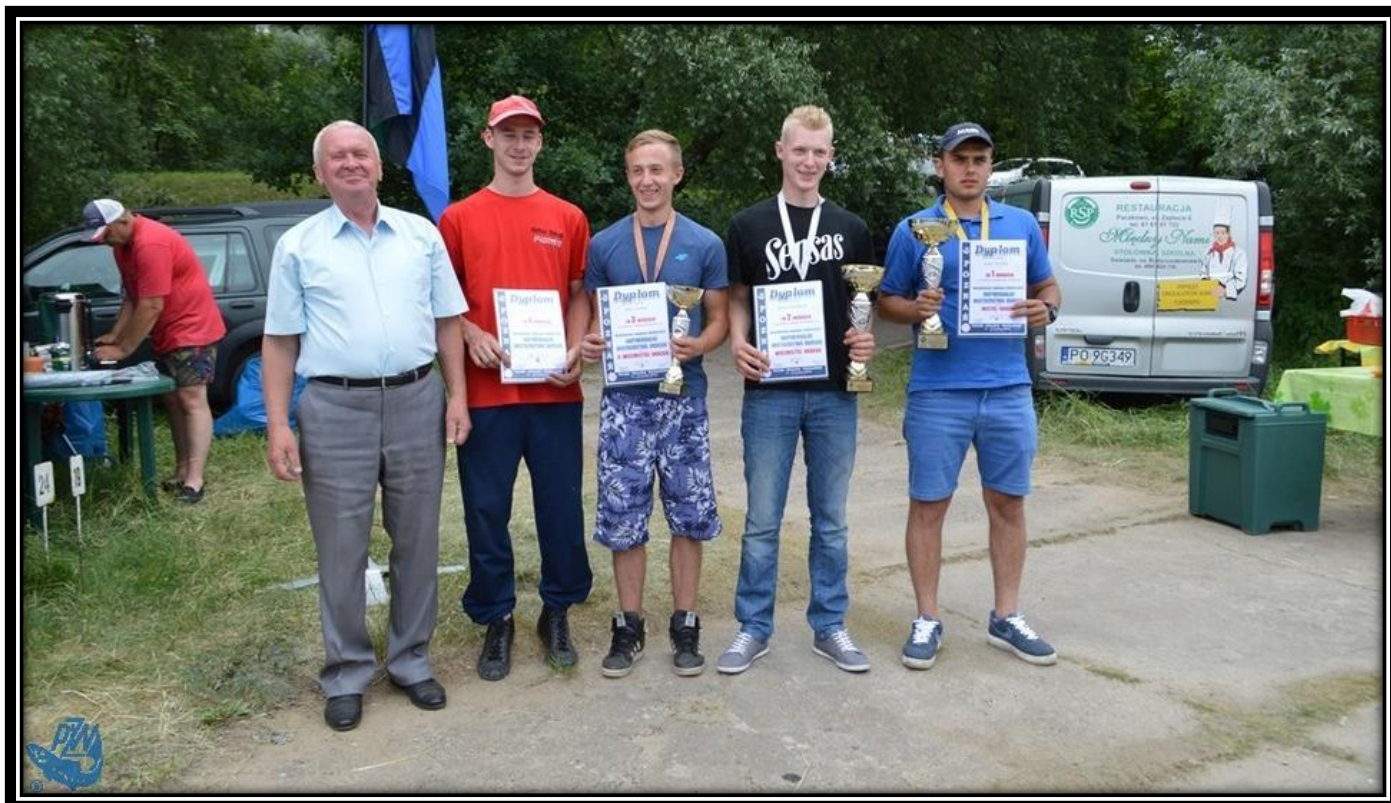
Mistrzowie Okręgu U23 w dyscyplinie sptawikowej 2016