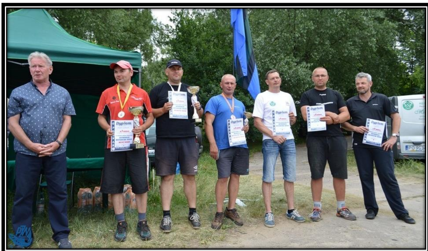
Mistrzowie Okręgu w dyscyplinie sptawikowej 2016