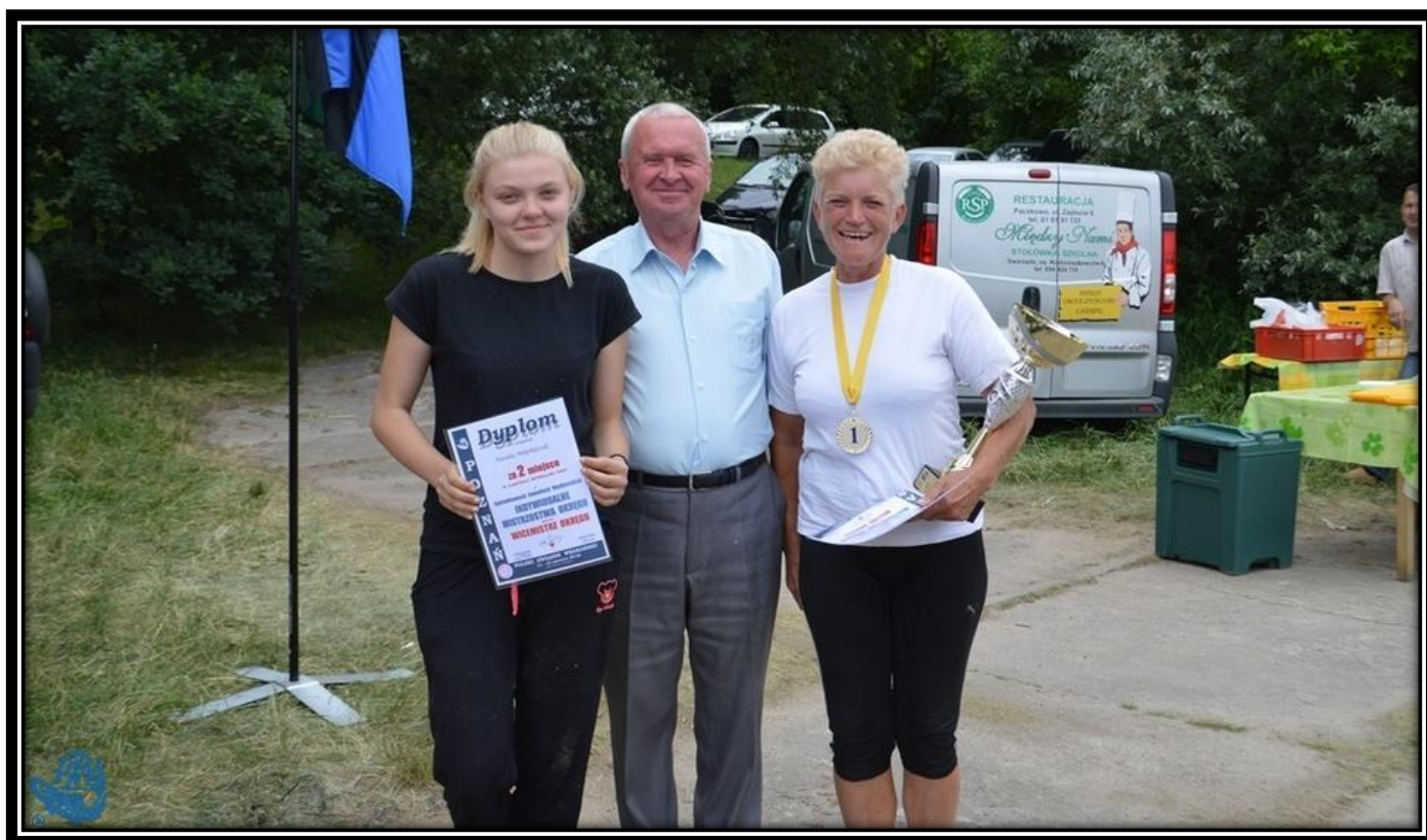
Mistrzynie Okręgu w dyscyplinie spławikowej 2016

6 miejsce – Artur Kubiak – Klub Leszcz Poznań