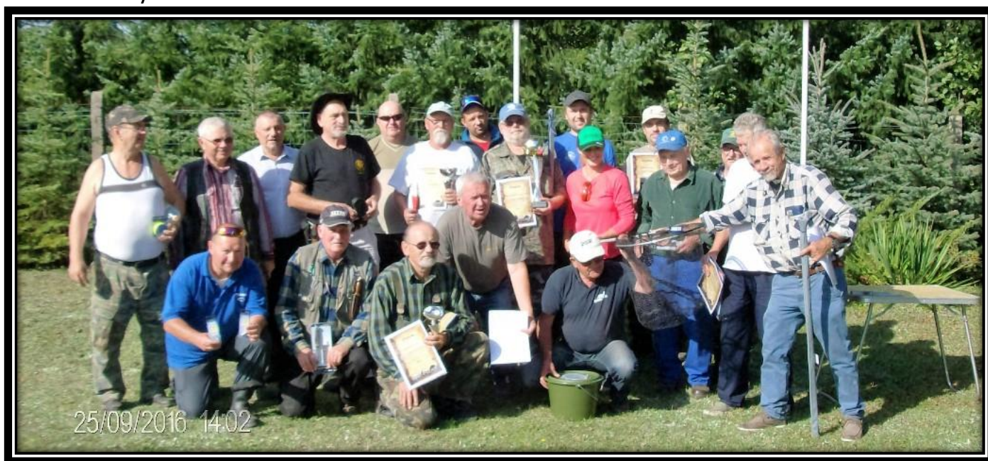
Zawody aktywu sędziów wędkarskich