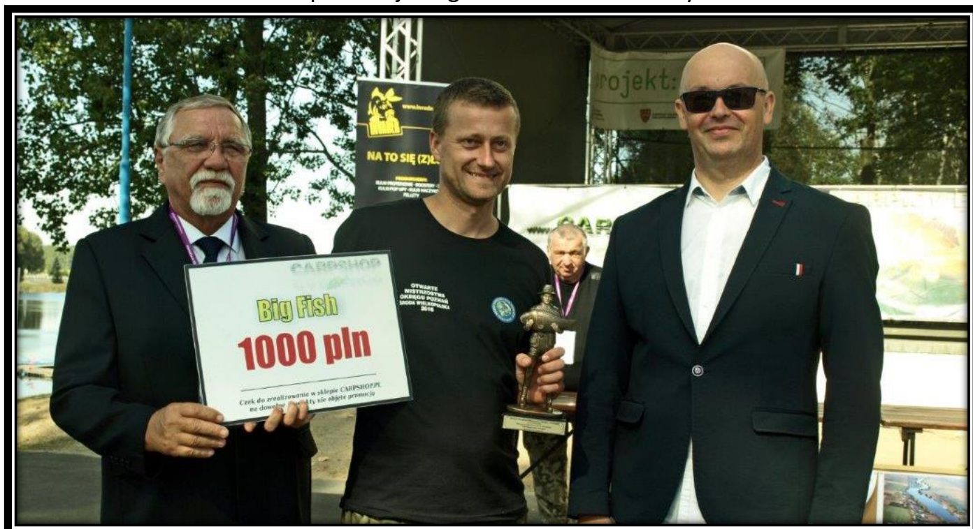
Łowca największej ryby zawodów – Karpiove Mistrzostwa Okręgu