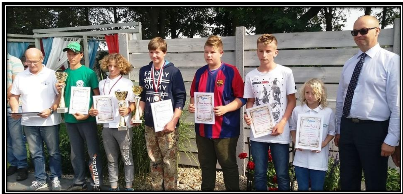
GPx Młodzięży 2016 - klasyfikacja U14